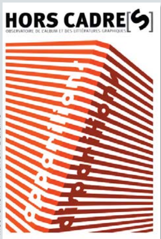
illustration : Marion Bataille

La revue Hors Cadre[s] , publiée conjointement par l'atelier du poisson soluble et les éditions Quiquandquoi, propose des regards croisés de critiques et de créateurs sur la production contemporaine d'albums et, plus généralement, sur les supports associant textes et images.