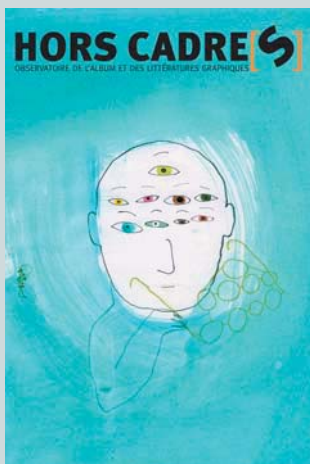
illustration : Hélène Riff

La revue hors cadre[s] , publiée conjointement par l'atelier du poisson soluble, les éditions Quiquandquoi et l'Institut International Charles Perrault, propose des regards croisés de critiques et de créateurs sur la production contemporaine d'albums et, plus généralement, sur les supports associant textes et images.