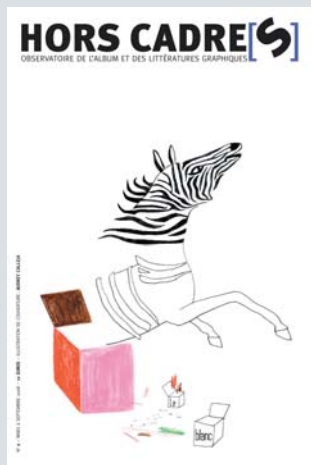
illustration : Audrey Calleja

La revue Hors Cadre[s] , publiée conjointement par l'atelier du poisson soluble, les éditions Quiquandquoi et l'Institut International Charles Perrault, propose des regards croisés de critiques et de créateurs sur la production contemporaine d'albums et, plus généralement, sur les supports associant textes et images.