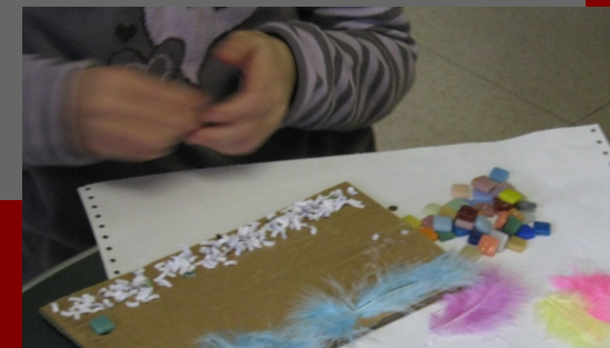
Concours d'Art Postal - décembre 2010